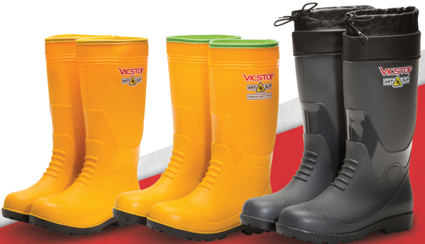
내산 / 내화학 안전장화